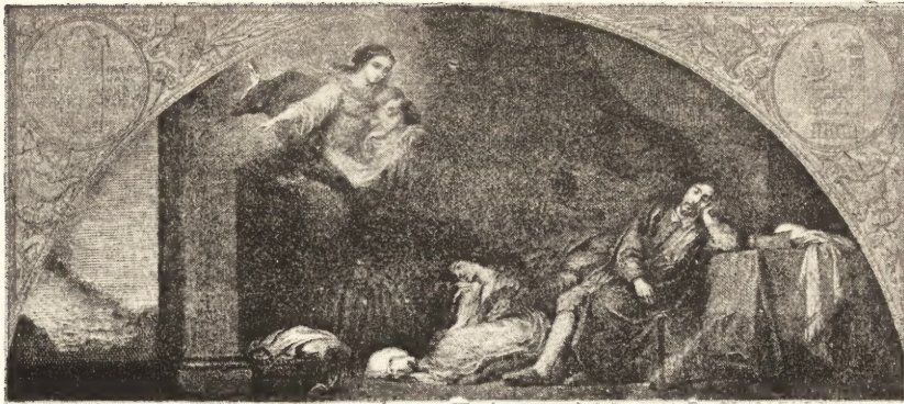
LE SONGE DU PATRICIEN.